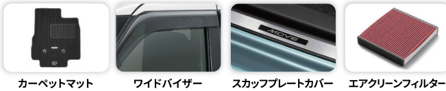
カーベットマット ワイドバイザー スカッフプレートカバー エアクリンフィルター